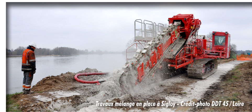
Travaux mélange en place à Sigloy

✓ Les principales mesures structurelles d'amélioration du val d'Ardoux à mettre en œuvre consistent à traiter les points de faiblesse de la digue dus à la présence de canalisations traversantes et de végétation.